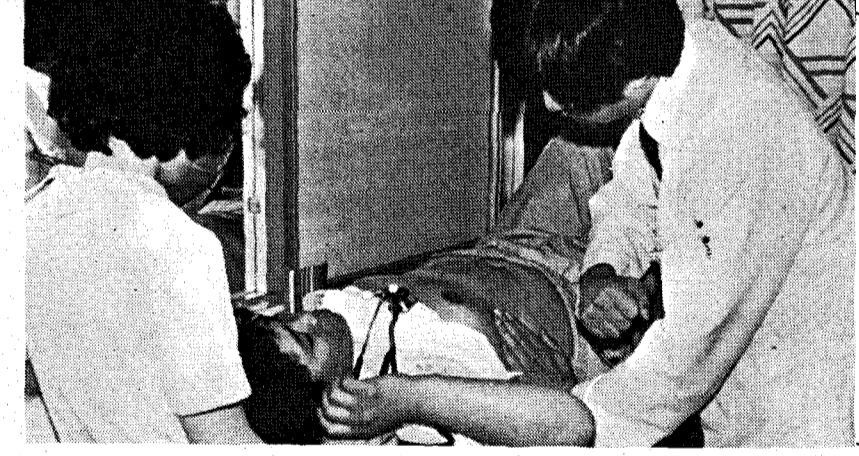
◇ 위암의 원 인으로 뚜렷이 밝혀진 것은 없으나 매우 짙은 음식이나 태운음식, 몹시 뜨거운 음식등 은 발암물질로 작용할 수 있기 때문에 이러한 음식들은 피하 는 것이 좋다. (사진은記事 특정 사실과 관 련없음)

◇ 먼저 구강증상으로는 구내 건조증이 가장 흔한 것으로 구 강호흡이나 불충분한 수분섭취, 침샘 위축에 의한 타액분비 감 소 등이 주원인이고, 음식에 대한 맛의 감소나 변화를 들 수 있는데 이는 연령증가에 따 른 냄새맡는 기능의 감소와 미 뢰의 위축, 맛에 대한 감각감 소 등이 원인이다. 그외에도 치주질환이나 불량한 구강 위 생상태에 의해서도 위와 같은 증상이 나타날 수도 있으므로 이런 경우 원인질환을 제거하여 주어야만 정상적인 음식물 섭 취가 가능하고 이로인해 생길 수 있는 노년층 영양결핍을 방 지할 수가 있다. ◇ 둘째, 식도증상으로는 연 하곤란이 가장 흔한 것으로 그 원인은 무수히 많으나 대개는 식도암등 기계적 병변이나 식 도의 운동능력의 감소, 식도열 공, 근육력증, 진균성 식도염 등과 뇌혈관 장애에 의한 가성