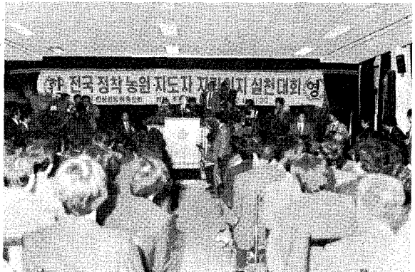
△ 민정당의 노태우 대통령후보가 참석, 격려하고 있다.

한성협동중앙회(회장 윤흥기)는 지난 12월 8일 농업기술진흥관에서 전국정착농원지도자 자립의지 실천대회를 성황리에 개최했다.