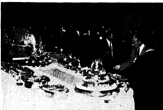
△ 수의사회지 창간30주년 기념축하연

대한수의사회(회장 정창국)는 지난 12월12일 수의사회지 창간 30주년 기념 축하연을 프라자호텔 덕수