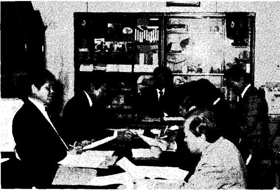
△ 가축개량협의회 닭분과위원회

농림수산부는 지난 12월19일 본회의회의실에서 가축개량협의회 닭분과위원회를 개최했다.