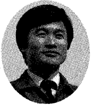
이 상호회장 (경기지역협의회)