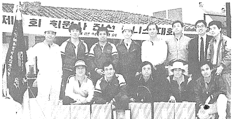
제8회 회원사 테니스대회에서 湖油精油가 종합우승을 차지하였다.