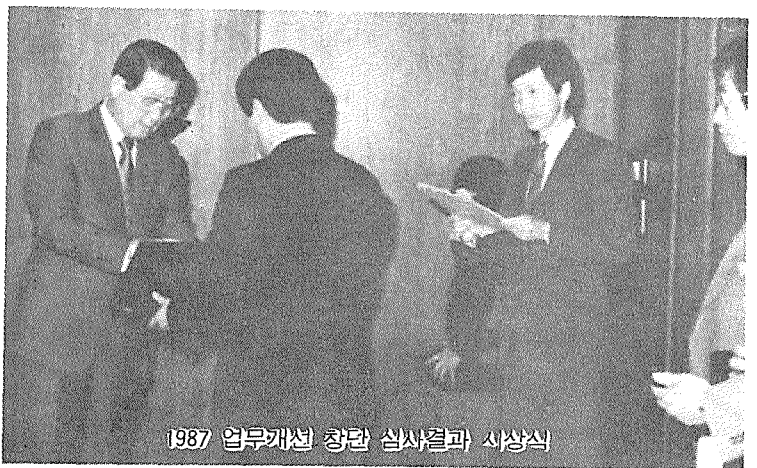
1987 업무개선 창안 심사결과 시상식

지난 76년부터 실시하고 있는 湖油의 직업훈련은 그동안 174명의 유능한 전문기능인력을 양성해 내었으며, 금년에는 엄격한 절차에 따라 선발된 33명의 훈련생들이 앞으로 6개월간 석유정제 직종에 관한 생산, 기술, 시험, 운영, 정비, 안전, 환경분야에 걸쳐 전문교관의 지도로 이론 및 실기교육을 받게 된다.