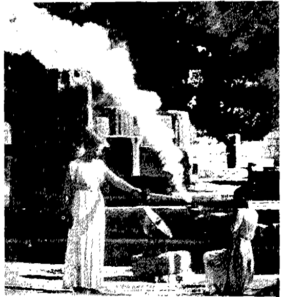
△ 성화를 태양광선으로 재화