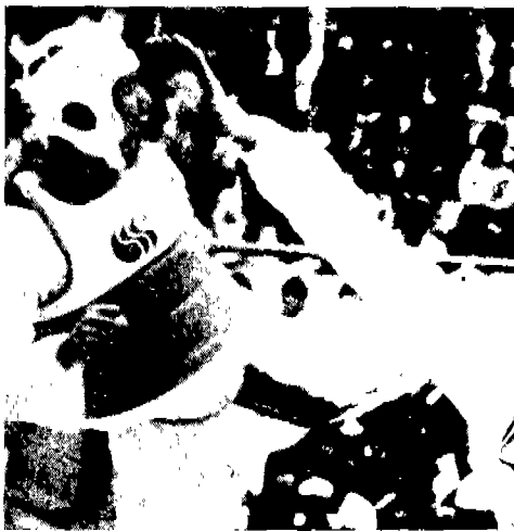
△ '88시범종목 태권도

서울올림픽에서 실시되는 정식종목은 육상, 수영 등 23개 종목으로, 이는 LA올림픽의 21개 종목에 탁구, 테니스가 새로이 추가되어 대회 사상 가장 많은 종목이다. 또한 세부종목도 237개