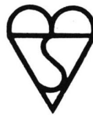
(1) 연마크 (KITE MARK)

BSI의 認證마크는 두가지의 種類가 있으며 하나는 대부분의 認證製品에 부착하는 것으로 그 모양의 이름을 따서 「연마크」(Kite Mark)라 하며, 다른 하나는 가스用品 또는 照明設備등에 부착하는 「安全마크」(BSI Safety Mark)이다.