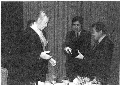
Miley 前 ADPA 회장에게 감사패 수여