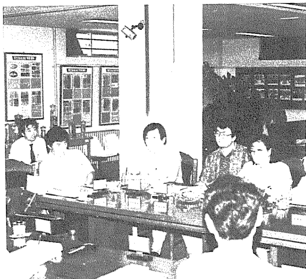
▶언론인 초청 간담회 에 참석한 전문지 기 자들이 주제 발표를 들 고 난 후 열띤 토론을 전개하고 있다.