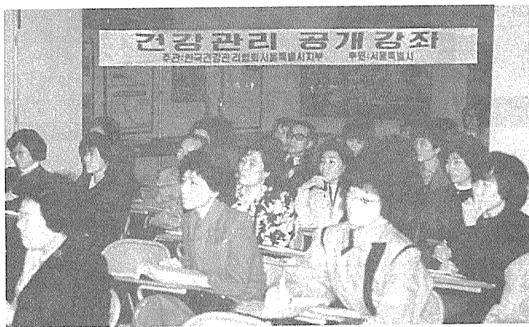
▼성황리에 마친 건강관리공개강좌의 마지막 강좌 "간장질환"을 듣기 위해 모인 일반주민들