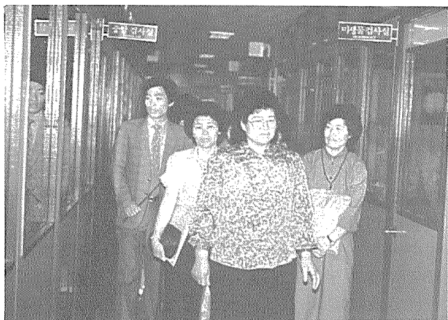
▲본회를 방문, 건협 서울지부 부속의원 시설을 견학하고 있는 제주도 孝敎 단위농협 부녀회장들

▼지난 5월 24일 건강관리 공개 강좌에서 최정연 박사(서울의대)가 심장질환에 대해 강의하고 있다.