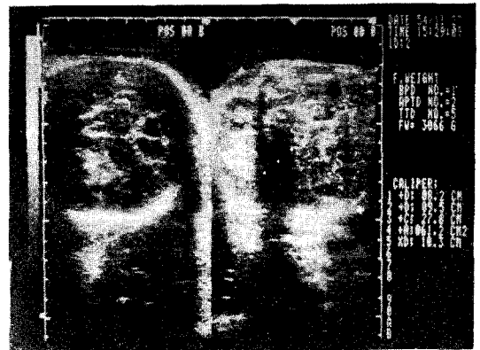
Fig. 2. Sono, finding, pregnancy at 37 wks in first baby.