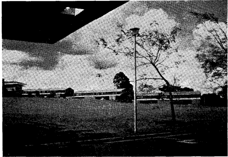
▲계단식으로 연결된 연구실험실 및 연구원 숙소의 일부. 광활한 초원 위에 2층이내의 건물들로 구성되어 연구와 실험에 편리하도록 배열되어 있는 것이 특징이다.

국제연합(UN) 산하 기구인 식량농업기구(FAO), 국제 원자력 위원회 (IAEA), 국제연합 개발계획(UNDP) 등의 재정적 기술적 지원과 세계은행(World Bank), 록펠러 재단 그리고 영국 등의 11개국으로부터 재정적 지원을 받아 운영되고 있는데, 1986년도의 연간 경상 운영비는 미화 10.5 밀리언 달러(한화로 약 900억원)에 달한