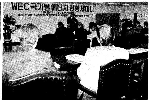
WEC 國家別 에너지統計 세미나