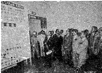
<INPOCO '85 전시현황 설명>

과학기술처, 환경청, 대한무역진흥공사, 한국기계공업전시회, 매일경제신문사