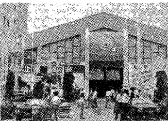
<INPOCO '83 전시장 입구>