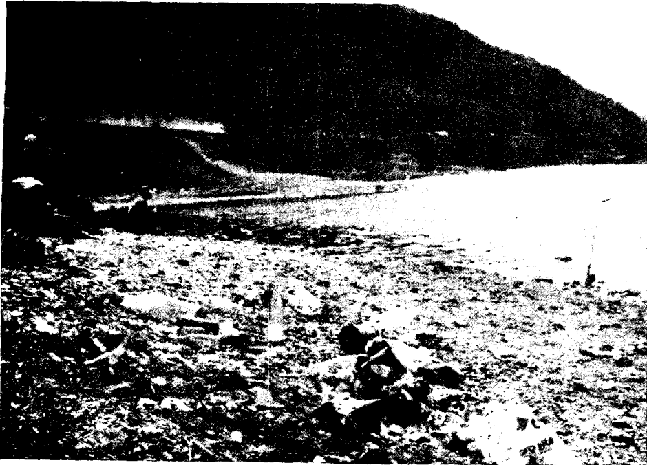
<양심 잃은 낚시터 (서효순·서울)>