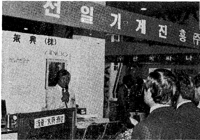
<참관자들에게 自社제품을 설명하고 있다.>

제 9 회 “국제 환경오염방지기기전시회(INPOCO/EMETEN '87)”가 내년 5월 22일부터 26일까지 5일간 서울 대한무역 진흥공사전시장(KOEX)에서 열린다. 근 10년째 지속되고 있는 INPOCO는 우리나라의 환경오염방지현황의 산 현장이라 할 수 있을만큼 연륜을 쌓아가면서 서서히 나름대로의 특징이 부각되고 있다. 특히 '88 올림픽을 앞두고 환경보전