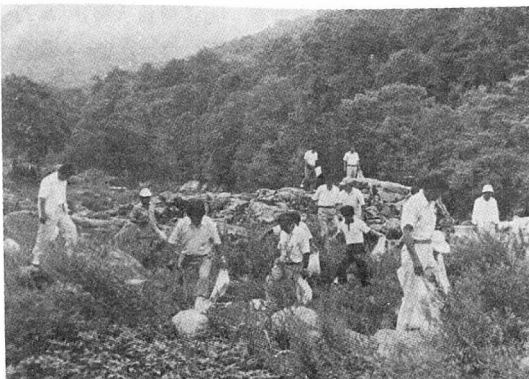
(계곡의 쓰레기를 줍는 회원들)