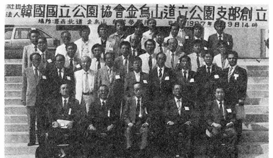
〈金烏산도립공원 지부 창립기념촬영〉