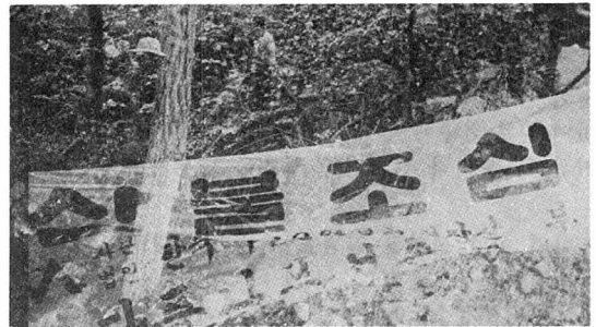
〈산불조심캠페인 및 잡목제거 작업광경〉