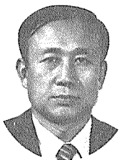
이 관 영