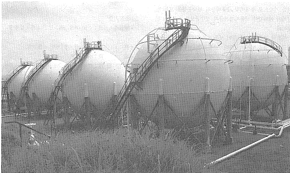
(사진설명) 유공 울산 공장의 LPG 저장탱크