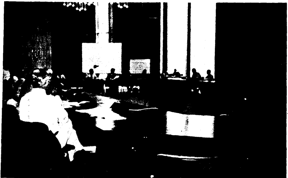
85 Bulgaria Sofia IEC大會 特別委員會光景