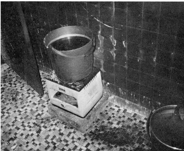
▲ 발화원이 된 석유콘로(주방내에 있는 이 콘로에 불을 끄지않은 채로 석유를 주입하다가 화재가 발생)

●자동화재탐지설비: 각층 1회로씩 7개회로(옥탑층 1개회로 포함) 설치되어 있었으나 자동화재탐지설비의 작동전에 화재발생 장소에 있던 종업원들이 이미 화재발생 사실을 알고 있었으며 자동화재탐