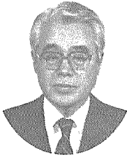
서 병 설