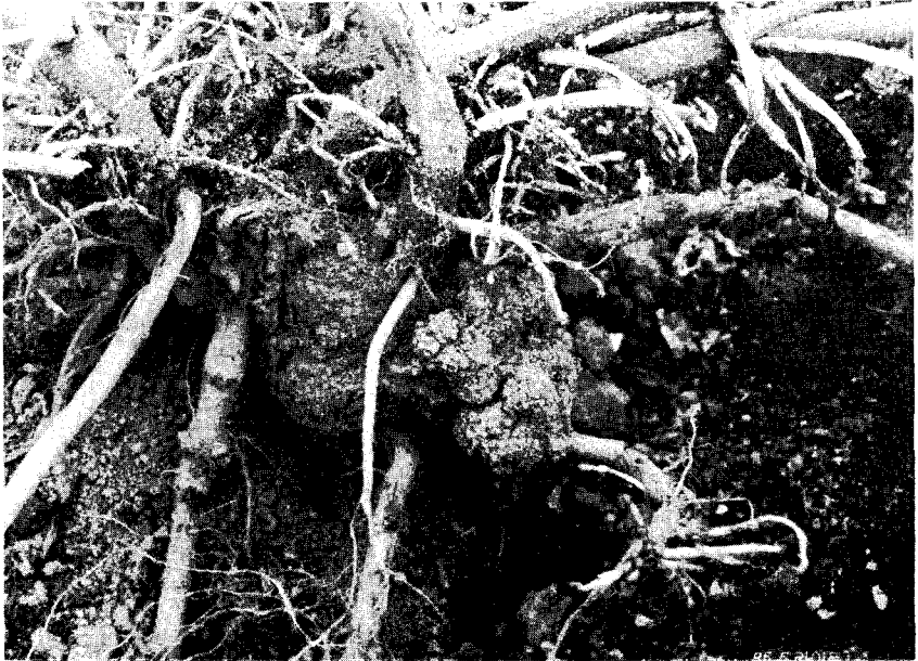
◇ 근두 암종병에 걸린 Hop