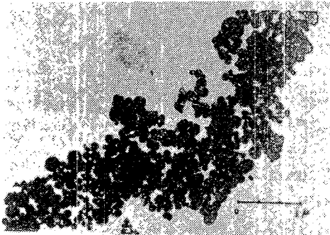
<그림-4> 연분진의 전자현미경사진

1) 매연의 성상이的確하게 파악되어 있지 않기 때문에 집진장치가 적절하지 못하였다.