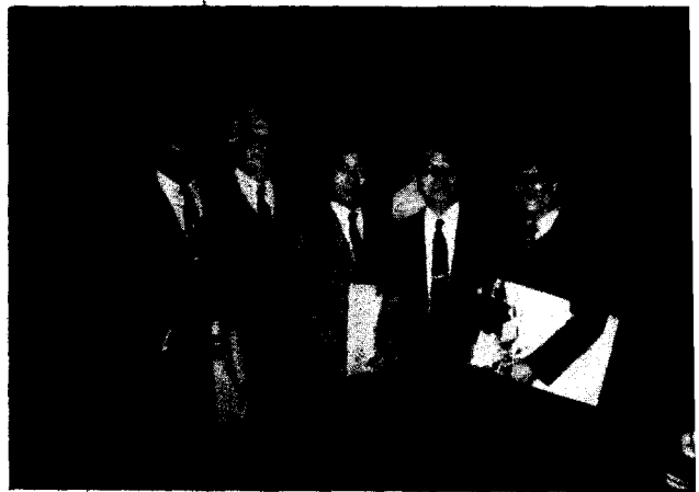
1984년도 1년과정 수료자 (필자: 중앙)

그리고 비영어권 국가의 학생을 위하여 어학 과정이 있으며, 이 과정은 미국의 Newyork 대학 어학연구소에 의한 교육으로 개학전에 실시하는 집중과정 (6시간/일) 과 학기중에 실시하는 정상과정 (3시간/일) 이 있다.