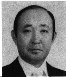
大韓病院協會 白樂院 회장은 지난 5월 5일 平安北道文化賞(사회개발부문)을 받았다.

올해로 여섯번째인 平北文化賞은 사회개발부문 외에도 학술 언론 예술 체육 등 총 9개 분야에 걸쳐 민족문화 창달과 향토문화 발전에 기여한 이 지역출신 인사에게 해마다 주어지고 있다.