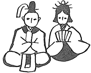
김 상 태