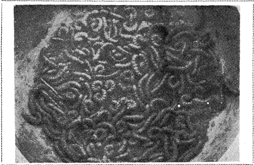
◇ 담배·고추·감자에서 가해하던 거세미 유충

특이한 어린잎의 엽육을 식해하여 기주식물의 잎이 자라게 되면 하얀 반점이 형성되거나 잎의 구멍이 뚫어지는 피해증상이 있어 작물이 자라는데 영향을 미친다.