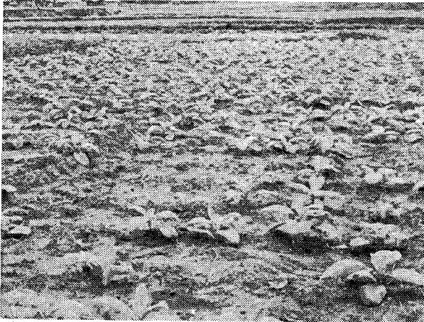
← 그림 2 거세미에 대한 담배의 약해시험 포장에서 무 처리구의 결구상태

제를 위하여 국가가 법령을 제정하여 해충의 방제를 하는 방법을 말한다. 국내에서 해충이 대발생되었을 때 방제령을 발동하여 해충피해가 더 확대되는 것을 막는 방법과 외국에서 발생하는 주요해충에 대하여 수입농산물에 묻어 들어오는 것을 사전에 방지하기 위하여 실시하는 식물검역방법이다.