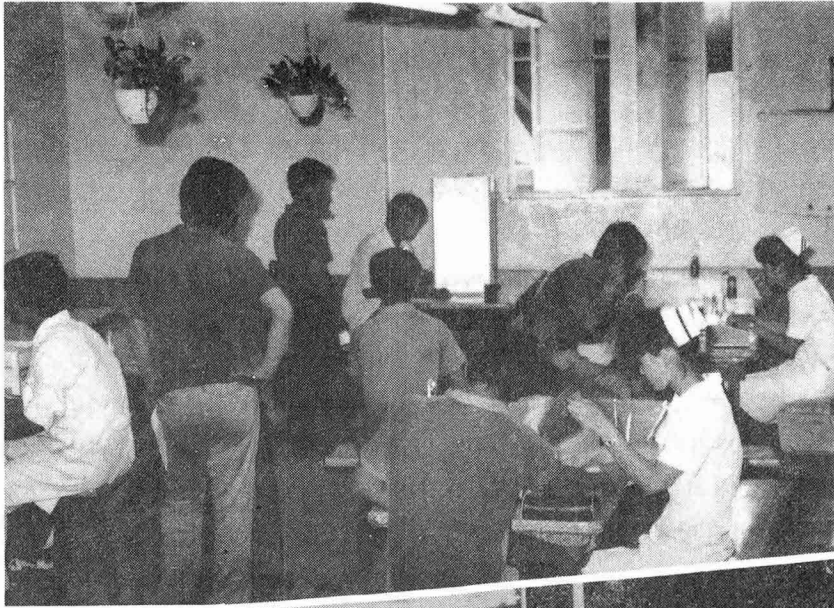
(대구승리기계제작소) 특수건강진단 현장

대구경북지부도 다른 지부와 마찬가지로 근로자의 건강보호와 증진을 위한 정기건강진단과 작업환경측정 및 보건관리대행업무를 수행하고 있으며, 사업장의 보건관리자와 보건담당자의 업무능력 배양을 위한 직무교육을 실시하고, 직업병 예방을 위한 학술조사연구 사업과 산업보건사업 확산을 위한 홍보 지도 계몽활동을 벌이고 있다. 동지부의 1984년도 사업계획과 7월말까지의 사업실적을 보면 다음과 같다.