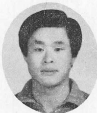
이 병 구