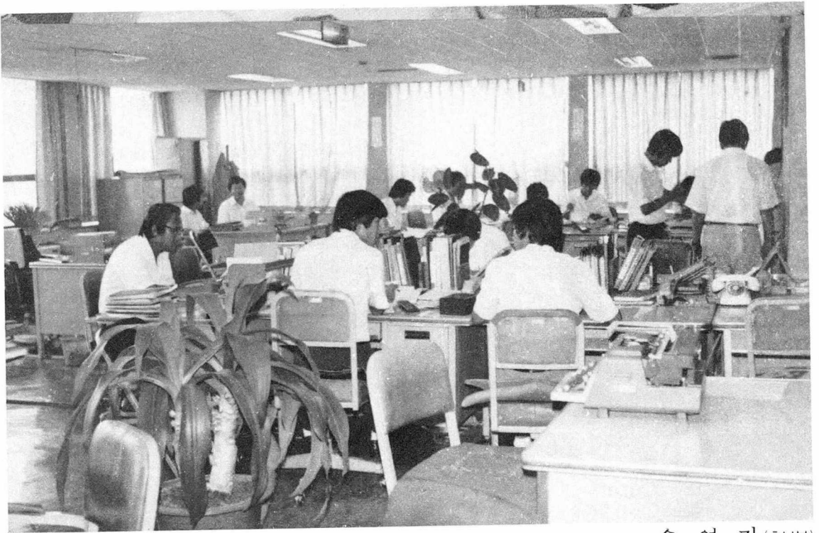
글: 송 영 기 <홍보부>