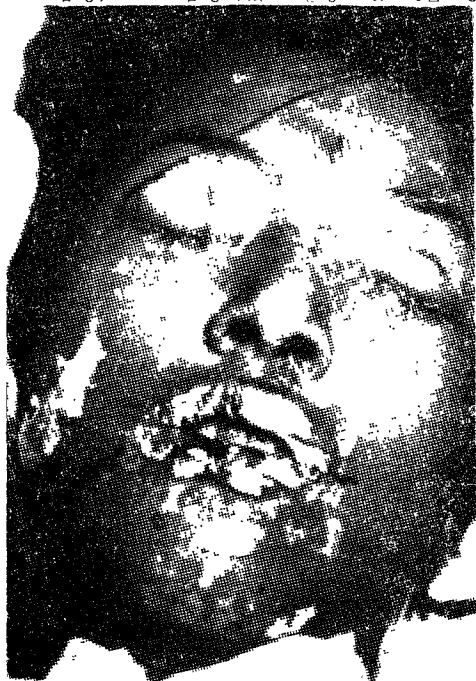
Fig. 1. Erythematous patches and scalded features of the face, nasal mucosae, and lips. The Nikolski sign is present on the upper eye lids.

임상검사 소견 : 일반 혈액 검사상 백혈구 6,200/mm 3 (분열핵 과립구 13%, 간상핵 과립구 53%, 후돌수구 13%, 임파구 19%, 호산구 2%), 혈소판 145,000/mm 3 , 혈색소 13.3g%로 미분화 백혈구가 증가된 이외에는 정상범위였다. 소변에 소량의 잠혈, 소변에 소량의 albumin이 검출되었다. 간기억 검사상 LDH 2082(150~550) IU/L, SGOT 286(10~33) IU/L, SGPT 149(0~40) IU/L로 증가되어 있었다(팔도 안은 정상범위). 혈청 검사상 CRP양성, ASO 음성, ANA 음성이었고 혈청 C 3 , C 4 는 정상