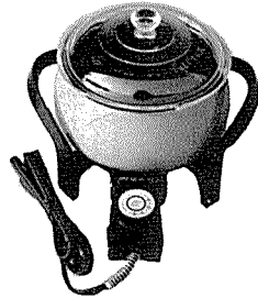
점보 독배기 <宇宙電機産業社>

주소: 서울 중구 충무로 1가 24-11 전화: 776-6333, 776-1777