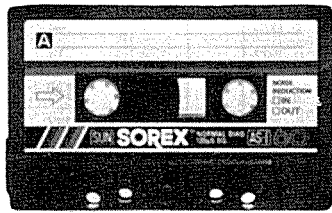
카세트 테이프 <善電子工業(株)>

주소: 서울 구로구 구로동 611-1 전화: 677-1115/9, 1530/3