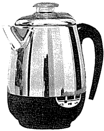
커피 포트 <大元電器産業(株)>

본 제품은 스텐레스 27종으로 강하고 외관이 미려하며 수명이 길다. 자동온도 조절기가 부착되어 있어 경제적이며 성능이 우수한 시이즈 히터(Sheathe Heater)로 적은 전력으로 빨리 끓일 수 있고 뚜껑 손잡이가 특수 수지로 되어 있다.