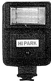
하이파크 HD2000 후레쉬 <新安産業>

전원: AC 100V/60Hz, 소비전력: 420 W, 코드: 1.8~2.0m