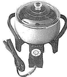
점보 뚝배기 <宇宙電機産業社>

주소: 서울 중구 충무로 1가 24-11 전화: 776-6333, 776-1777