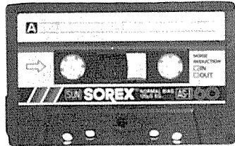
카세트 테이프 <善電子工業(株)>

본제품은 SOREX 브랜드로 수출에 주력해 온 지 수년 만에 국내 판매를 시작한 것으로 60, 90분용 등 다양하다. 시판되는 테이프는 SS-I (육성 녹음용), SS-II (육성 녹음용 및 경음악용), AS-I (세미클라식용), AS-II (클라식용) 4종.