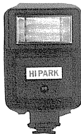
하이파크 HD2000 후레쉬 <新安産業>

외관, 구조, 성능면에서 종래의 미비한 점을 완전 보완하여 설계 제조한 제품으로, 완전 자동온도조절장치 부착, 고성능 시이즈 히터 부착 등으로 저전력 및 높은 열효율이 특징이다. 특수 테프론 코팅 처리로 눌러 붙는 일이 없다.