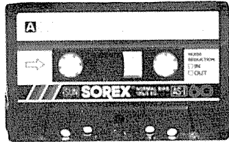
카세트 테이프 <善電子工業(株)>

주소: 경기도 부천시 원미동 44의 8 전화: (132)63-1771/2 (서울)28-3112