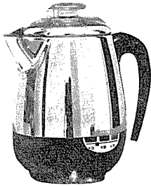
커피 포트 <대원電器産業(株)>

본 제품은 스텐레스 27종으로 강하고 외관이 미려하며 수명이 길다. 자동온도 조절기가 부착되어 있어 경제적이며 성능이 우수한 시이즈 히터(Sheathe Heater)로 적은 전력으로 빨리 끓일 수 있고 뚜껑 손잡이가 특수 수직으로 되어 있다.