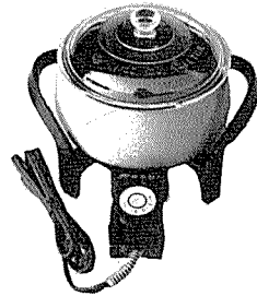
점보 뚝배기 <宇宙電機産業社>

주소: 서울 중구 충무로 1가 24-11 전화: 776-6333, 776-1777