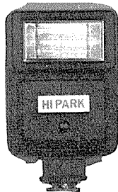
하이파 HD2000 후레쉬 <新安産業>

전원: AC 100V/60Hz, 소비전력: 420W, 코드: 1.8~2.0m