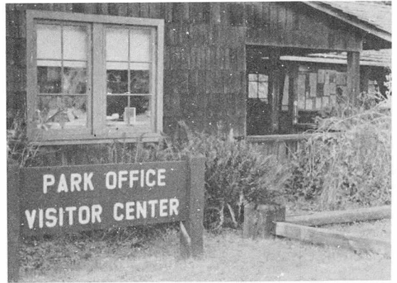
레드윈 국립공원 관리소에서, 캘리포니아주 북쪽에 있는 건물의 외관은 대단치 않으나 진열관이 있고 내용이 매우 충실하였다. (1982. 12. 27)

둘째는 미국이 建國 200년을 지난 새로운 나라이지만 그들 선조가 숲을 끊어 문화를 만들어 나가면서 땅을 흘렸고 이러한 사실을 인식하면