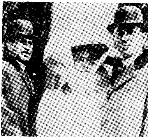
오빌 라이트(左)와 윌버 라이트(右) 兄弟

그리하여 그림 3(機體를 비스듬히 後方에서 본다)과 같이 左右舷翼端의 後緣支柱 各 2本の