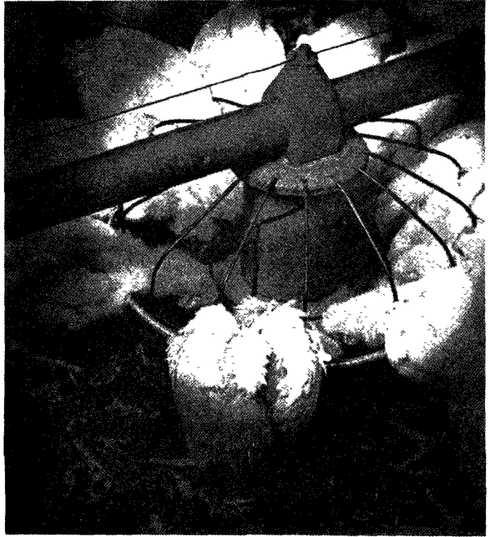
표 2. 시험에 사용된 육계사료의 배합비

또한 공시된 효소제는 A 효소로서 그 성분은 앞에서 설명한 바와 같으며, 그 첨가수준은 A 효소 1g중 세룰라제의 여과지붕괴활성 1,000단위 함유한 것(편의상 A'-1로 칭한다.)으로 0.1%첨가와 0.3%첨가를 하였다 배합사료에 첨가된 비타민 첨가제의 첨가수준은 일본사양표준에 맞춘 것이다.