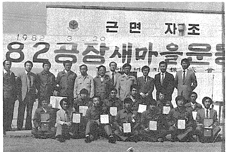
◇ 京仁에너지仁川工場새마을운동前進黨

京仁에너지는 지난 3월 20일 仁川공장에서 82年度 工場새마을운동전진대회를 열고 새마을운동을 통해 生産性向上과 노사협조체제