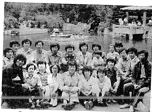
◎ 중앙회소속 회원친목야유회