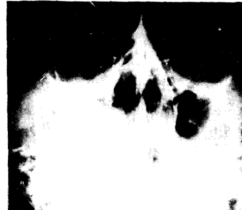
Fig. 6. 조영촬영상에서 낭종의 명확한 외형과 상악동 측벽의 소실이 보인다.