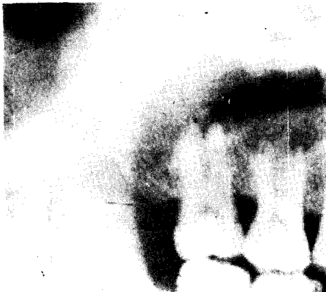
Fig. 5. 낭종의 경계가 불명확하다.