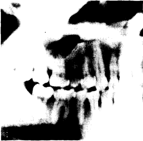
Fig. 1. 단방성 술후성 상악낭종