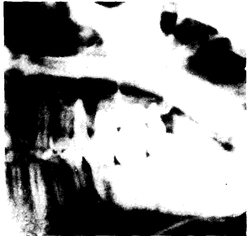
Fig. 2. 다방성 술후성 상악낭종