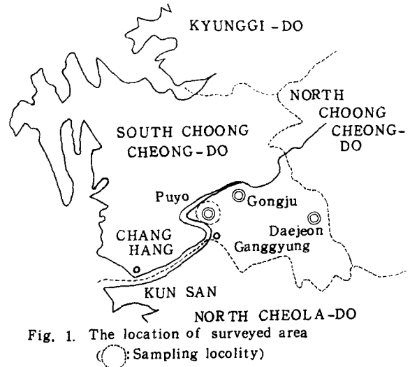
Fig. 1. The location of surveyed area

本調査에서 使用했던 皮內反應用 診斷液은 國立保健研究院에서 製造된, 肺 및 肝吸虫 抗原(VBS Ag)으로 實施方法에서는 肺 및 肝吸虫用으로 各各 1個의 Tuberculin 用 注射器에 25gauge needle을 使用하였다. 注射部位로는 被檢者의 前膊部 屈側面을 擇하여 알코올 스폰지로 여러번 닦은 후에 5cm 2 程度의 間隔을 두고서 肺 및 肝吸虫 抗原을 皮內에 各各 0.02 ml 程度 注射하여 丘疹의 直徑이 20mm 2 程度 되게