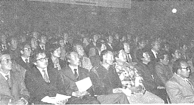
◎ 補修教育實施光景

建築士法 施行令 第29條의 規定에 依하여 全國 建築士 및 關係 公務員을 對象으로 서울(漢陽大學校강당) 大田(카톨릭會館) 釜山(釜山市庁강당) 등 3個地域으로 区分 實施된 이번 補修教育은 聃立住宅 비위 別決에 關한 事項과 建築法令 및 建築士法令 解說等을 重點的으로 다루었다.