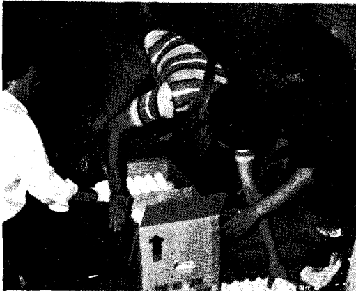
△ 각지에서 모여든 계란을 상자에 넣고 있다

아침부터 양계장에는 알장수가 계란을 기다리게 되었고 대란이하 적은 알들이 귀해지자 그렇게도 체화계란으로 걱정하던 양계장이 이번에는 중란을 구해달라는 알장수들의 요청에 전지기 어렵게까지 되었다.