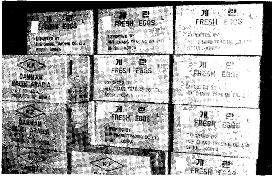
△ 신선한 계란이 들은 수출상자