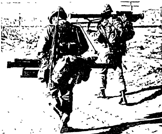
〈그림 3〉 Stinger는 1人휴대가 가능하다

미사일은 射手로부터 安全距離인 25 ft(7.6m) 비행후 飛行推進機關이 止動되고 二重推力 Roc- ket Motor가 標的에 命中하기까지 米사일을 추 진시킨다.