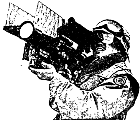
<그림 1> Stinger는 완벽한 赤外線 유도탐색감지기를 갖고 있다.

Redeye와 比較하여 그 크기가 조금 큰程度이며 길이는 約 20%가 커서 1.52m, 무게는 約 16% 무거운 15. kg이며, 彼我識別裝置는 별도의 Belt Pack에 의하여 공급된다.