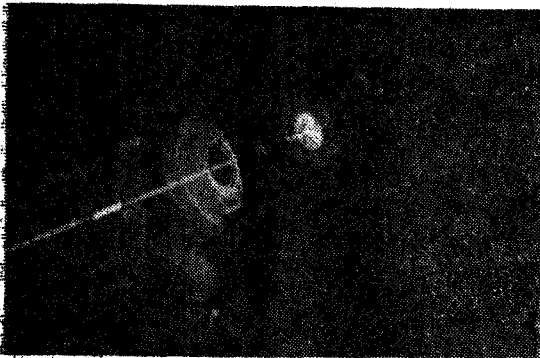
〈사진 1〉 루비레이저發生裝置

이것을 또한번 재차 흡수시키면 50원이 蓄積되어 2백 50원의 赤外線으로 增幅(振動數는 變化가 없다)되는 強力한 赤外線이 放出된다. 이때 反射鏡을 이용하여 계속 흡수시키게 하면 幾何級數的으로 增幅되어 굉장한 에너지의 赤外線으로 勵起되어 放出한다.