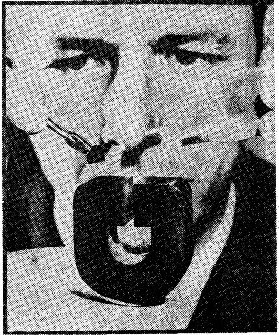
〈사진 2〉 레이저의 心臟部 人造루비

즉 10원이 蓄積되어 50원자리의 사과(綠色)가 나올수도 있지만 10원이 모여 50원이 되어 그 50원자체(赤外線)가 튀어나오는 경우도 있다. 이것을 勵起輻射의 增幅(Light Amplification of Stimulated Emission of Radiation) 혹은 레이저(LASER)라고 부른다.