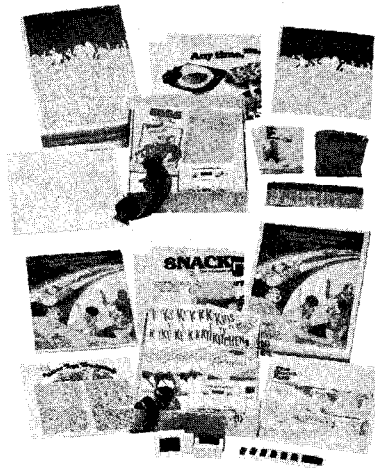
AEB의 각종 소비촉진 홍보물

않는 것이 없습니다. 미국은 지금 말씀 드린 것과 같은 시스템을 60년대 초부터 시작 하였고 일본도 요즘은 한창 이러한 방식으로 상품화 하고 있습니다.