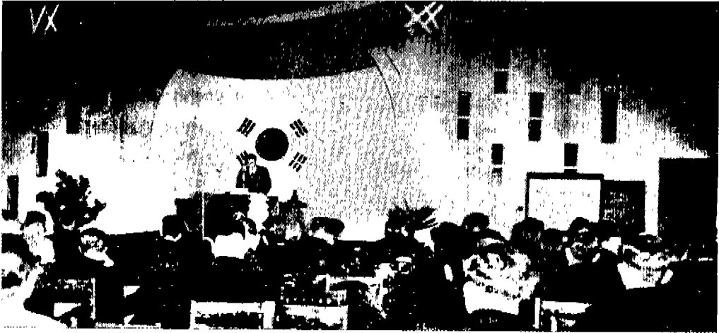
〈大韓電氣協會 創立總會 光景 (1965年)〉

시고 官廳에 오래 계셨던 분이래, 그래서 그런지 매우 形式主義이시고 매우 근엄하셨다. 5~6명 모이는 常務理事會議에도 開會·閉會·決議가 너무 分明하고 形式化되어 그 때마다 나는 分明한 것은 좋으나 저렇게까지 嚴格하게 해야 하나 하는 생각을 했었다.