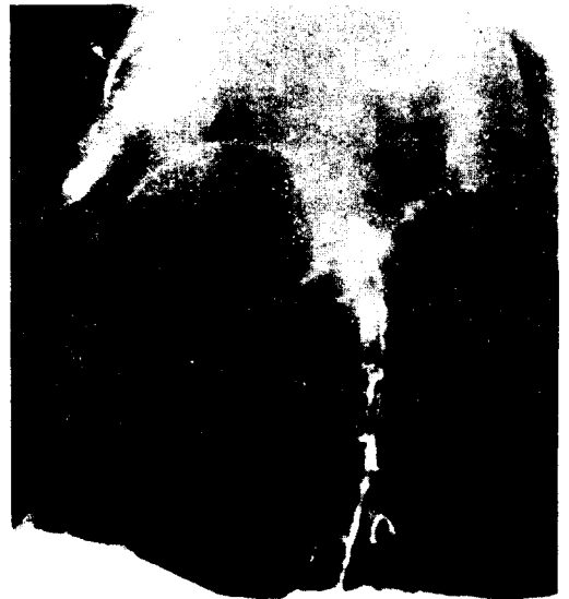
사진 II. Aortogram