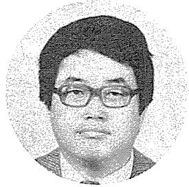
閔 英 基 (理博 · 國立天文台長)