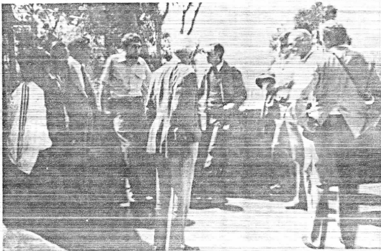
< 로알 國立公園 監視員의 說明을 듣고 있다 >