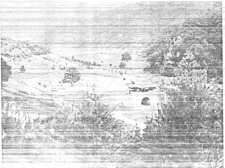
聞慶 第1關門(主 屹關)을 背景으로 하는 裏團施設地區 豫定지의 全景