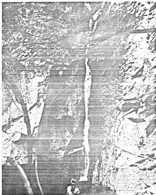
惠國寺로 가는 도중 장엄한 모습을 드러내고 있는 瀑布로 서, 높이 約 20 m, 女宮瀑布 一 名 女心, 처녀폭포라 한다.