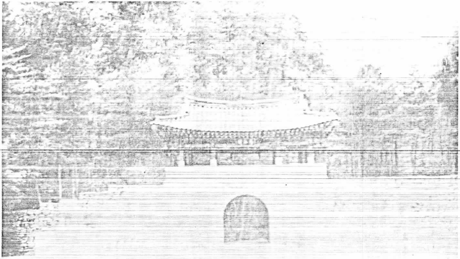
主屹關에서 3 km 쪽에 位置하였 며 3關門中 樹 風致 등 是邊景 이 가장 秀麗한 慶 第2關門(鳥 關)