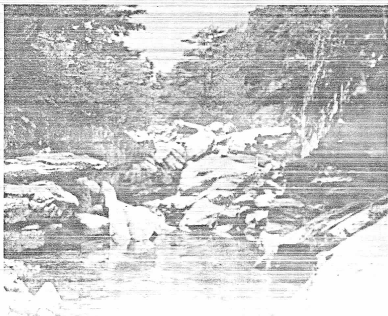
溪谷을 흘러내리 는 맑은 물이 마치 銀河水와 같고 風 景은 小金山을 방 불케 하는 八王瀑布 (龍湫)의 全景